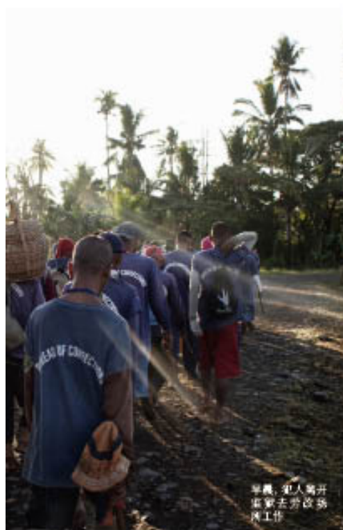
早晨，犯人离开 监狱去开始农 作工作